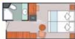
Floor Diagram Interior Sleeps up to: 4 592 Cabins Cabin: 130 sqft (14 m 2 ) * Size may vary, see details below.