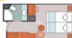
Floor Diagram Interior Sleeps up to: 4 592 Cabins Cabin: 130 sqft (14 m 2 ) * Size may vary, see details below.