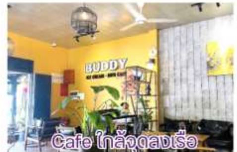
Cafe ใกล้ลงเรือ