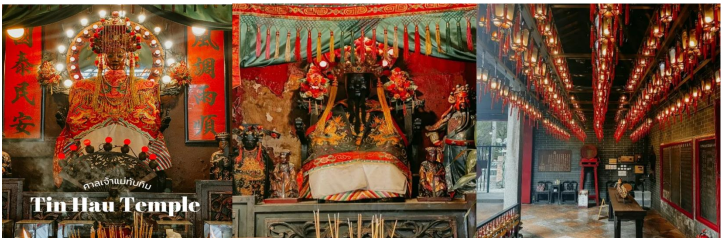
ศาลเจ้าแม่ทับทิม Tin Hau Temple

นำท่านเดินทางสู่ วัดเจ้าแม่ทับทิม ทินฮั่ว (Tin Hau Temple) ที่ย่าน เหยา มา เต(Yau Ma Tei Station) เป็นวัดเก่าแก่และสำคัญอีกวัดหนึ่งของฮ่องกง เพราะในสมัยก่อน ฮ่องกงเป็นเพียงหมู่บ้านชาวประมง ซึ่งเคารพนับถือเจ้าแม่ทับทิมว่าเป็นเทพีแห่งทะเล จึงไม่น่าแปลกใจที่จะมีวัดเจ้าแม่ทับทิมกระจายตัวอยู่หลายสิบวัดเลย การจุดธูปเกลียวขนาดใหญ่สีแดงเพื่อขอพร ราคา 188 เหรียญ โดยธูปจะติดนาน 7-8 วัน โดยจะมีถาดรองซีไถ่ทองเหลืองอยู่ด้านล่าง นอกจากการมาสักการบูชาเจ้าแม่ทับทิมในเรื่องของการเดินทางให้ปลอดภัยแล้ว ไฮไลท์สำคัญอีกอย่างหนึ่งของวัดเจ้าแม่ทับทิม ทินฮั่ว (Tin Hau Temple)จะเป็นขดธูปสีแดงขนาดใหญ่ที่แขวนอยู่ตามเพดานด้านในวิหารของวัดเต็มไปหมด จะยิ่งสวยงามในยามที่มีแสงแดงส่องลงมาเหมือนเป็นลำแสงส่องทะเลลึกลับวันรูปแบบลึกลับตายนั่ง