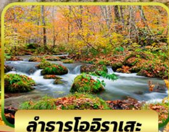
ลำธารโออิระเสะ