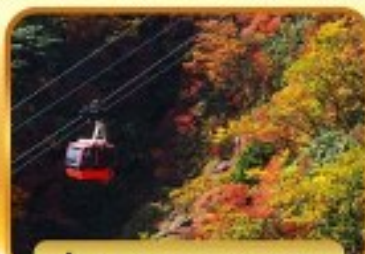
นั่งกระเช้าภูเขาโทโซไซ