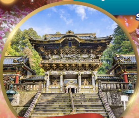
ศาลเจ้านิกโก้ โทโฮกุ