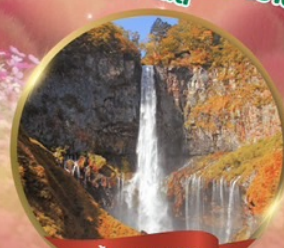
น้ำตกเคกอน