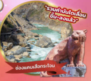
"รวมค่าบ่อนโต้คลื่น บับ-ลงแล้ว"