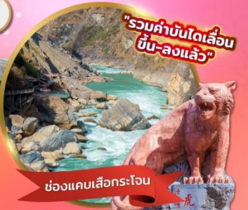
"รวมค่าบัตรรถไฟความเร็วสูง ขึ้น-ลงแล้ว"