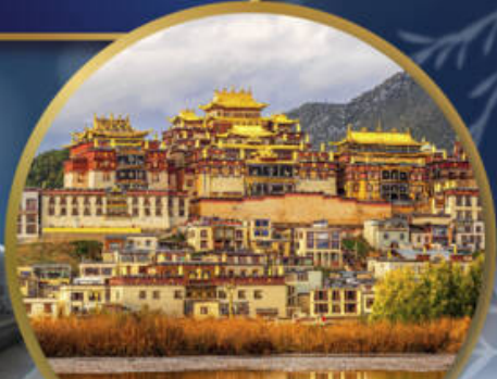
วัดลามะชงจ้านหลิน