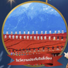
โซ่วความประทับใจลี่เจียง

ขึ้นกระเช้าใหญ่ ชม ภูเขาหิมะมังกรหยก + ชมโซ่วความประทับใจลี่เจียง เมืองโบราณลี่เจียง • เมืองโบราณต้าหลี่ • เมืองโบราณแฉงกรี่ล่า อุทยานน้ำหยกป๋อสู่ยเหอ • วัดลามะชงจ้านหลิน • ช่องแคบเล็องกระโจน • เขาซีซาน