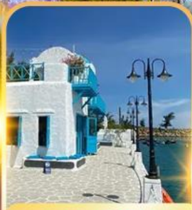
SON TRA MARINA CAFE