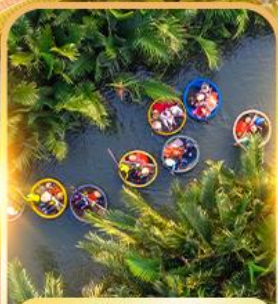
เรื่อกระดิง