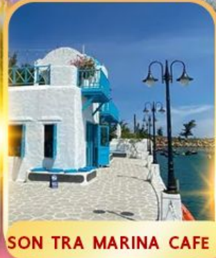
SON TRA MARINA CAFE