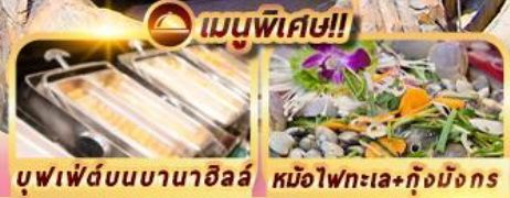
บุฟเฟ่ต์บนบานาฮิลล์ หม้อไฟทะเล+กุ้งมังกร