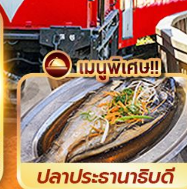
ปลาประดานารีบตี