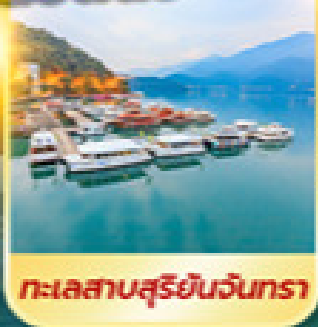
ทะเลสาบสุรียันจันตรา