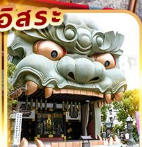
ศาลเจ้านิมบะยาซากะ