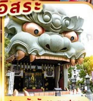
ศาลเจ้านัมบะยาซากะ