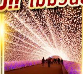
นาบาระโนะซาโตะ