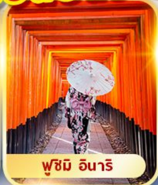
ฟูชิมิ อินาริ