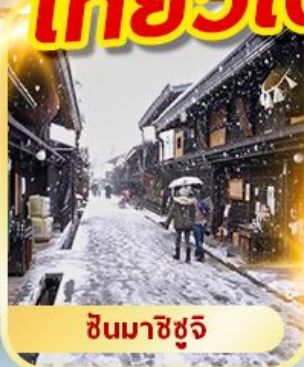
ชินจิซุจิ