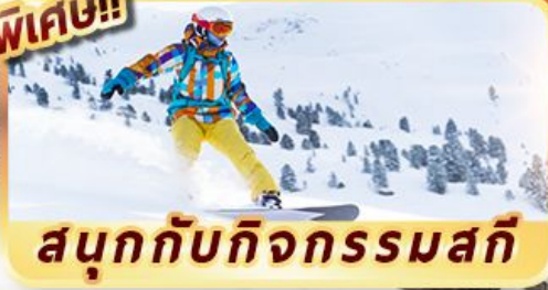
สนุกกับกิจกรรมสกี