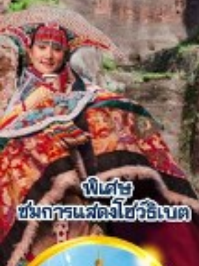
พิเศษ ชมการแสดงโชว์อู๋เบต