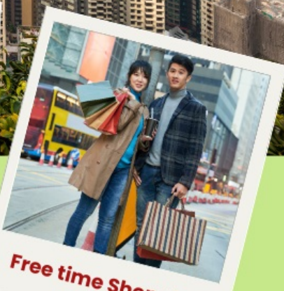
Free time Shopping