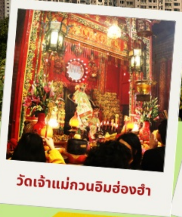
วัดเจ้าแม่กวนอิมฮ่องกง