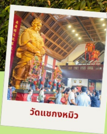
วัดแชกงหมิว