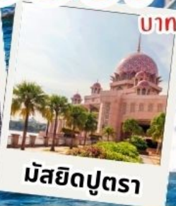
มัสยิดปุตรา