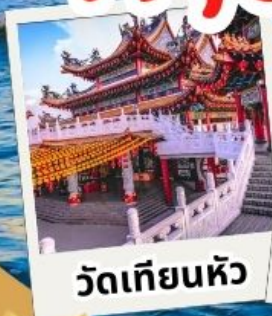
วัดเทียนหัว