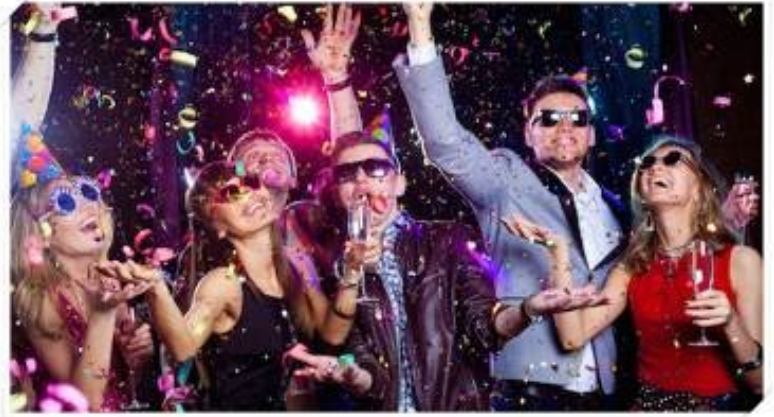
ENJOY THE NIGHT OF FANTASTIC PERFORMANCE