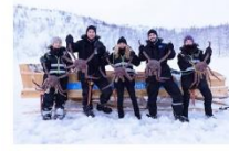
สนุกกับกิจกรรมจับปูยักษ์

00.00 น. ออกเดินทางสู่ เมืองคีร์กเคนส โดยสายการบิน...เที่ยวบินที่... 00.00 น. เดินทางถึงสนามบินเมืองคีร์กเคนส