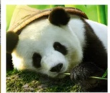
ศูนย์หมีแพนด้า