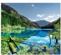
จั๋วจ้ายโกว

จาก 8 ชม. เหลือ 2 ชม. เร็วทันใจด้วยรถไฟความเร็วสูง เฉิงตู - จั๋วจ้ายโกว