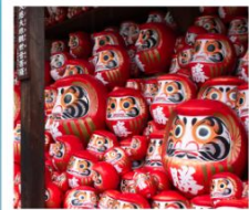
วัดคิตสึโอจิ