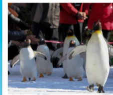
สวนสัตว์นิกเซ่

วัดคิตสึโอจิ / ปราสาทโอซาก้า / ย่านชินไซบาชิ ห้องเรือทะเลสาบโทยะ / โทริเยวคะคุ ทาวเวอร์ โกดังอิฐแดงคานโมริ / นั่งกระเช้าภูเขาอาโทะดาเตะ ตลาดเช้าเมืองอาโทะดาเตะ / สวนสัตว์นิกเซ่ ภารินพาร์ค พิพิธภัณฑ์กล่องดนตรี / นาฬิกาไอน้ำโบราณ โรงเป่าแก้วคิตาอิชิ / เนินพระพุทธรเจ้า / มิซึย เอ้าเค็ทท์