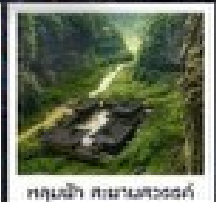
อุทยานแห่งชาติฟิงชานฮวงตี้