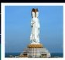
เจ้าแม่กวนอิมเทพนิรมิต