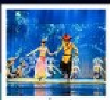
โชว์สีสันฤดูร้อน