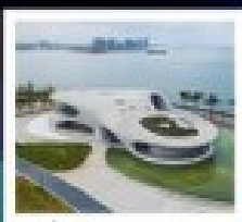
หอนาฬิกาอุทยาน