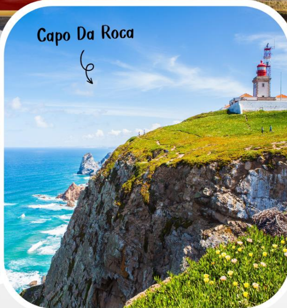
Capo Da Roca