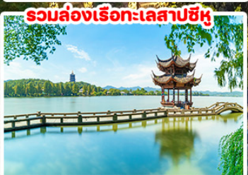
รวมล่องเรือทะเลสาบซีหู