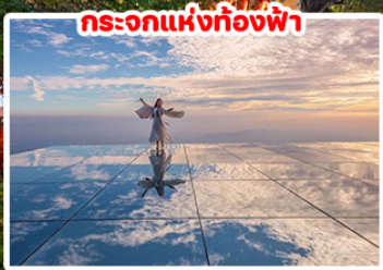
กระบอกแห่งท้องฟ้า