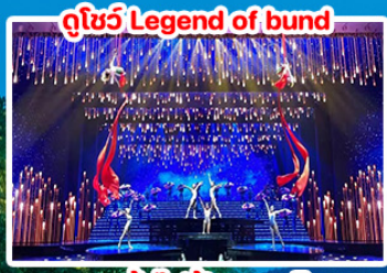
ดูโชว์ Legend of bund