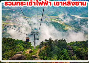
รวมกระเช้าไฟฟ้า เขาหลินซาน