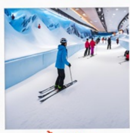
บ้านหิมะ WINDOW OF THE WORLD