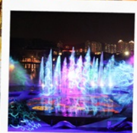
โชว์น้ำสามมิติ OCT BAY WATER SHOW