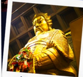
วัดเชกงหวี