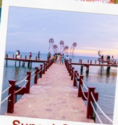
Sunset Sanato Beach Club