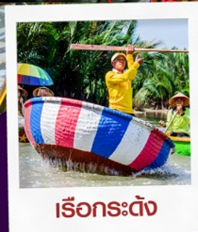
เรือกระด้าง