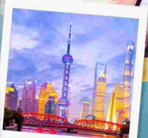
ทาดว่ายทาน