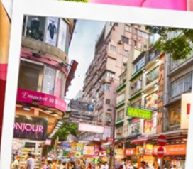
ช้อปปิ้งย่านมงก๊ก