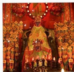
เจ้าแม่กวนอิมวัดสองอ่า