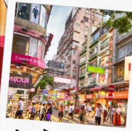
ช้อปปิ้งย่านมงก๊ก