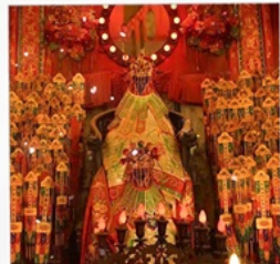
เจ้าแม่กวนอิมวัดสองฮา