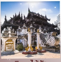
วิหารไม้สัก เขตตานานจอง