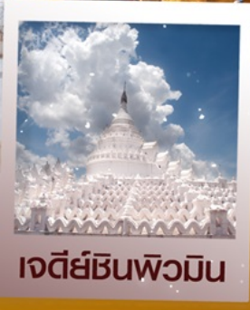
เจดีย์ชินพิวมิน