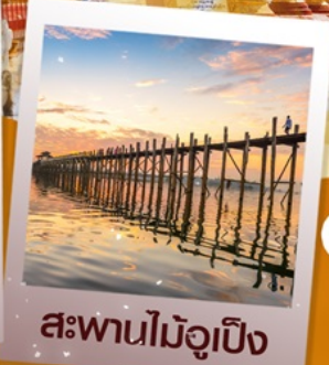
สะพานไม้จูปิง