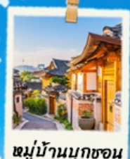
หมู่บ้านนุกซอน