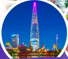
ตึกลิโอดเต็มจลล์