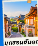
มุกซอนฮันอก