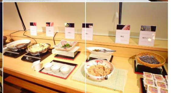
Sendai Business Hotel Ekimae