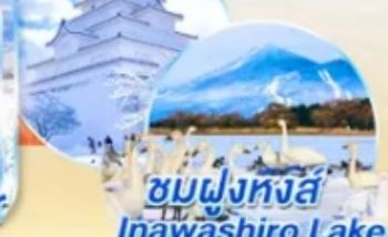
ชมฝูงหงส์ Inawashiro Lake