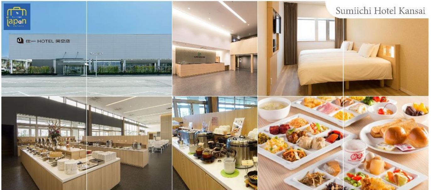
Sumiichi Hotel Kansai

พักที่ SUMIICHI HOTEL KANSAI หรือเทียบเท่าระดับเดียวกัน (โดยรถบัสโรงแรม)