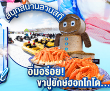
อ้มอร่อย! ชาบูยักษ์ฮอกไกโด...

ไฮไลท์!! สนุกสนานและกิจกรรม ณ ลานสโนว์ เวิลด์ ซึคิโซฟาโนราฆ่า ฟินไปกับหมู่บ้านเทพนิยาย กลางป่า นิงเกิ้ลเทอร์ส เดินชม คลองโอตารุ ในบรรยากาศสุดแสนโรแมนติก ลิ้มรส ราเมนต้นตำรับ ช้อปปิ้งจิวเออรี่ อีออนอาซากาว่า และ ย่านซูซุกิโนะ เข้าชม พิพิธภัณฑ์ที่กล่องดนตรี อ้มอร่อย!!! บุฟเฟ่ต์ชาบู+ชาบูยักษ์แห่งเกาะฮอกไกโด