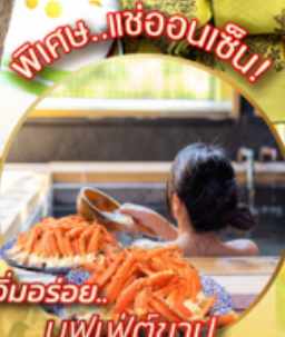
อิมมอร์รี่... บุฟเฟ่ต์ขาปู