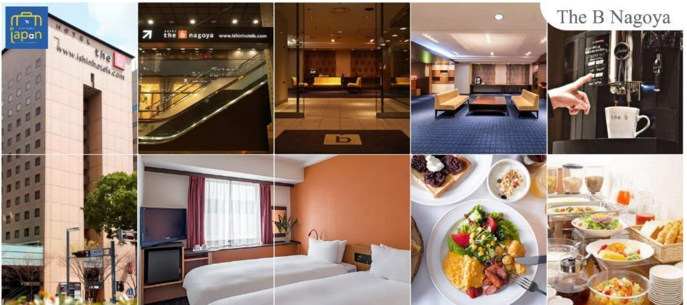
The B Nagoya

พักที่ HOTEL THE B NAGOYA หรือเทียบเท่าระดับเดียวกัน