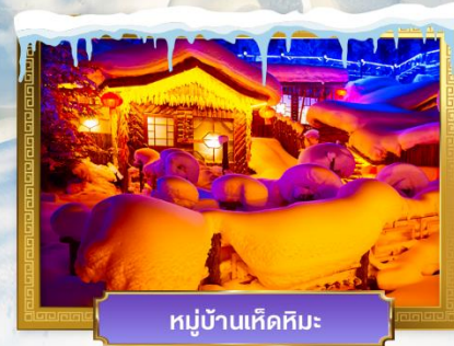
หมู่บ้านเห็ดหิมะ

เดินทางโดย : สายการบินโซน่าเซาเทิร์นแอร์ไลน์