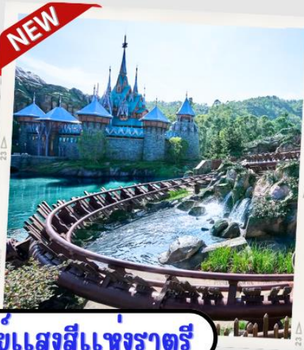
“MOMENTOUS” มหึศจรรย์ขแสงสีแห่งราตรี