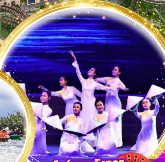
โชว์สุดอลังการ Charming at danang