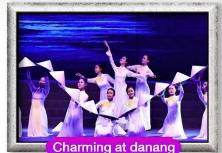
Charming at danang