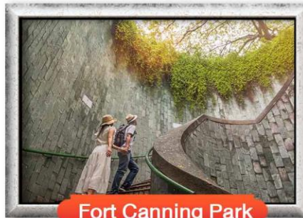
Fort Canning Park