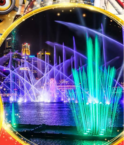
Light & Water Show