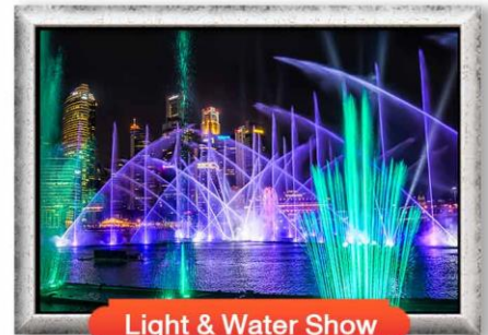
Light & Water Show