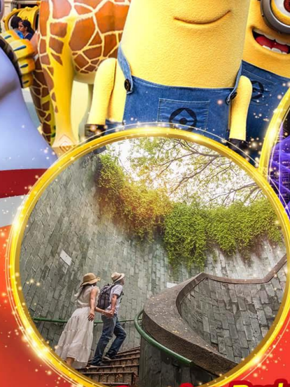
Fort Canning Park