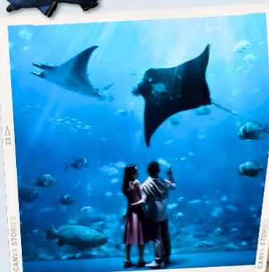
ZONE 7 : FAR FAR AWAY