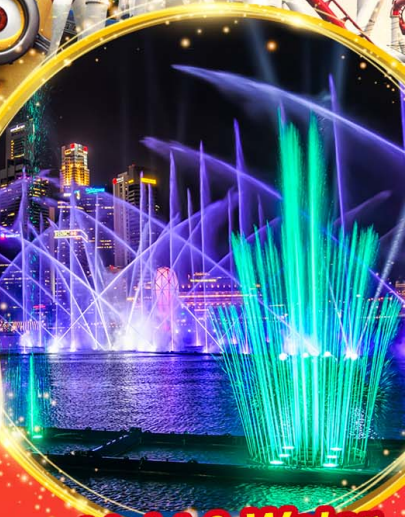
Light & Water Show