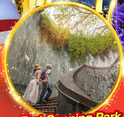
Fort Canning Park