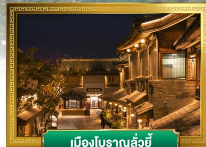
เมืองโบราณลั่วอี้