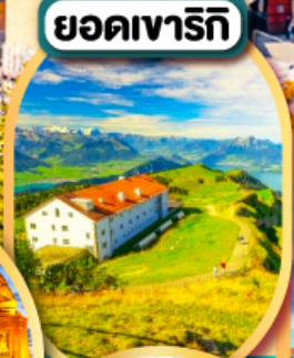
ยอดเขารีกี