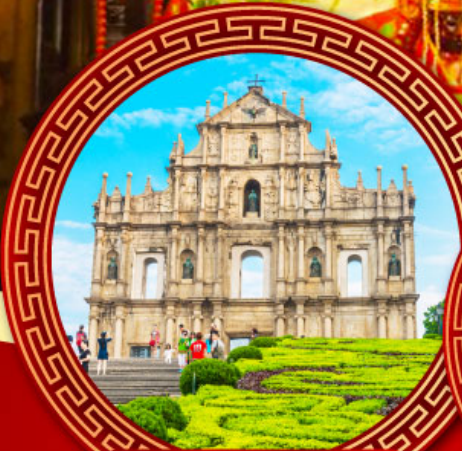
โบสถ์เซนต์ปอล