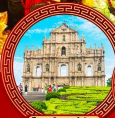
โบสถ์เซนต์ปอล