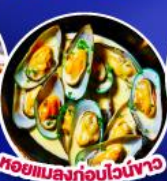
หอยแมลงภู่อบไวน์ขาว