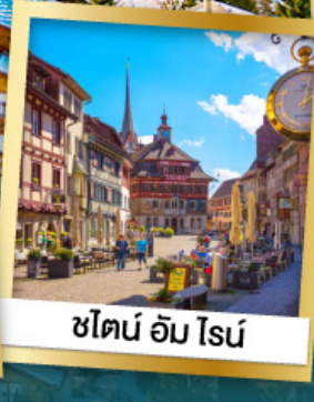
ชิลอน อัม โรน