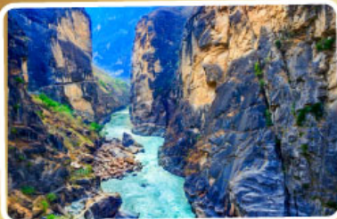
ช่องแคบเล็กระโจน