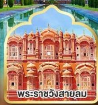
พระราชวังสายลม