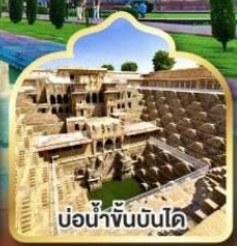
บ่อน้ำขั้นบันได