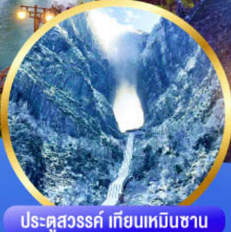
ประตูสวรรค์ เทียนเหมินซาน