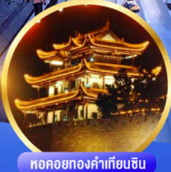
หอคอยทองคำเทียนซิบ